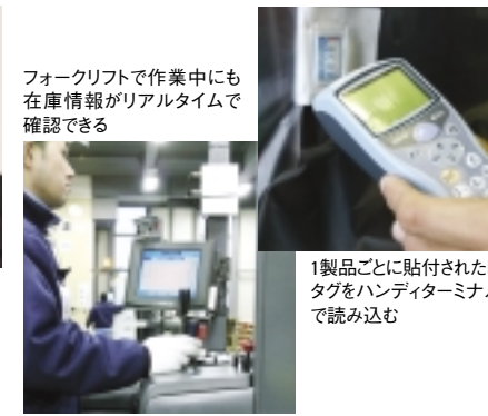
フォークリフトで作業中にも在庫情報がリアルタイムで確認できる